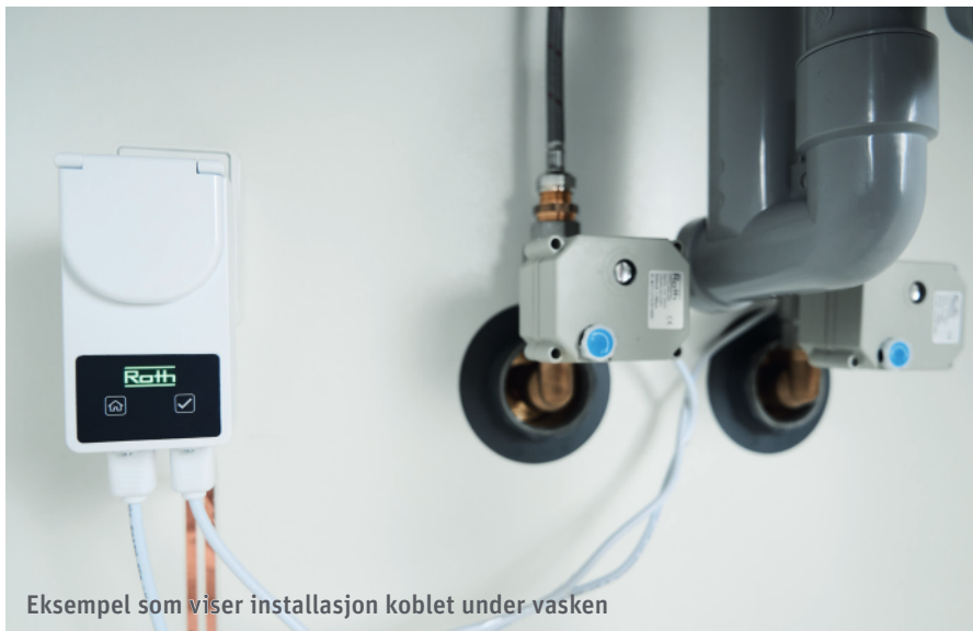
Eksempel som viser installasjon koblet under vasken