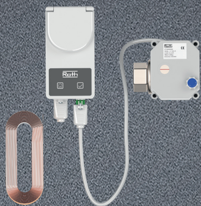
Roth QuickStop Sensor 1