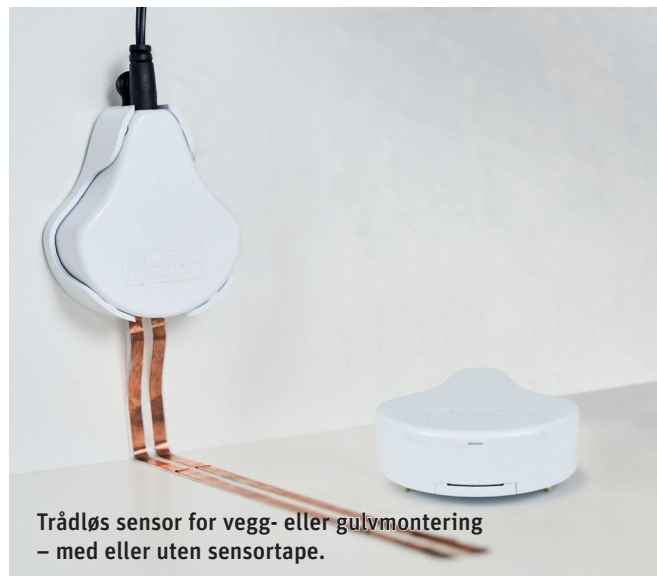
Trådløs sensor for vegg- eller gulvmontering – med eller uten sensortape.