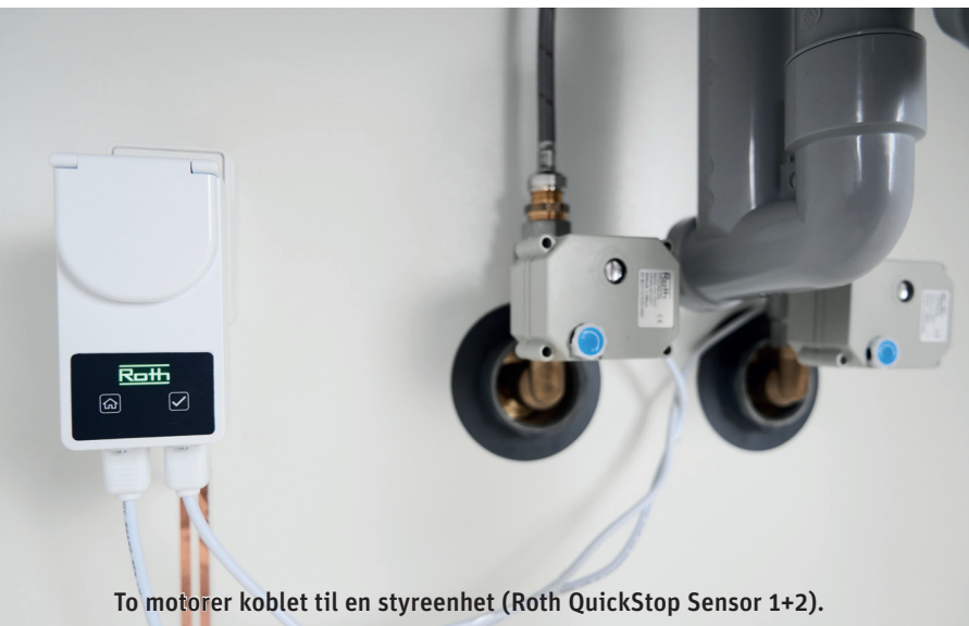
To motorer koblet til en styreenhet (Roth QuickStop Sensor 1+2).