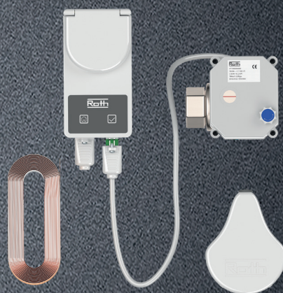
Roth QuickStop Sensor 2